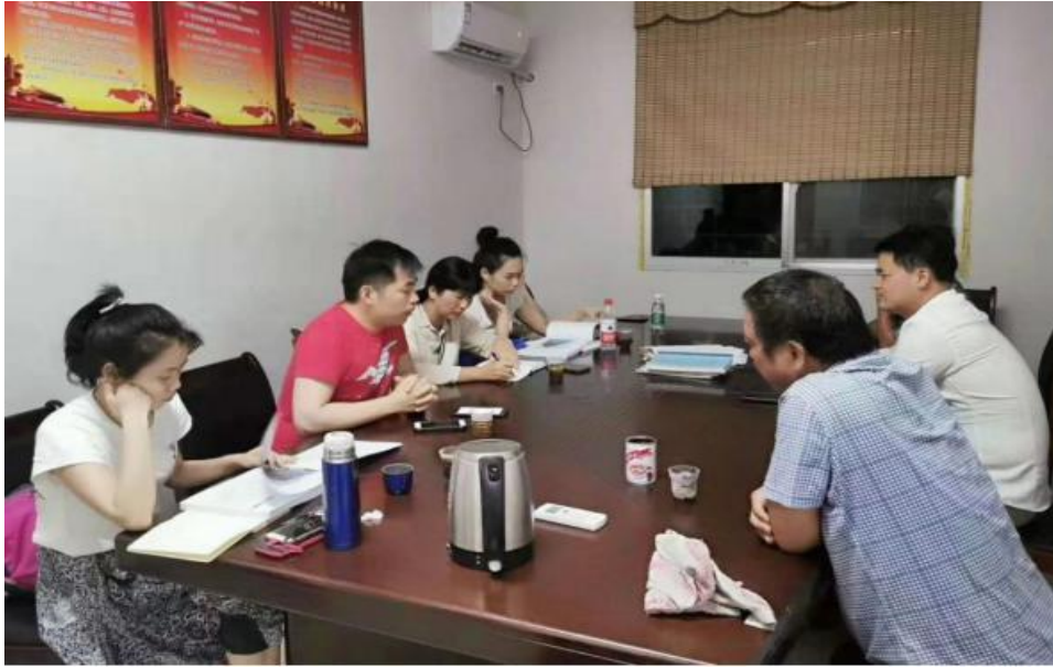
图7 学院美术系师生赴雪峰村进行景观规划设计实地调研