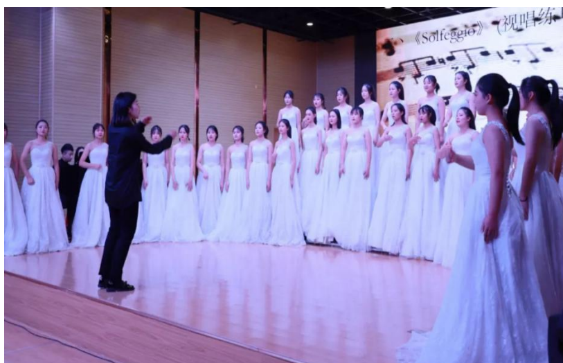
图 3 音乐厅

3. 校企合作双元育人，提高专业质量。 “校企合作、工学结合”是我国当前职业教育改革和发展的内在要求和必由之路。这种创新人才培养模式是以国家职业标准为依据、以工作任务为导向、以综合职业能力培养为核心的一体化教学，其核心是贯彻以能力为本位的现代职业教育思想。我院通过课程体系和教学方法的改革创新，按照“教、学、做”一体化的教学要求，校企共同制定职业教学标准、构建课程