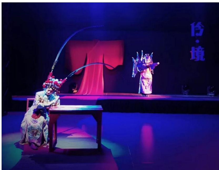
图 2 灯光舞美实训室