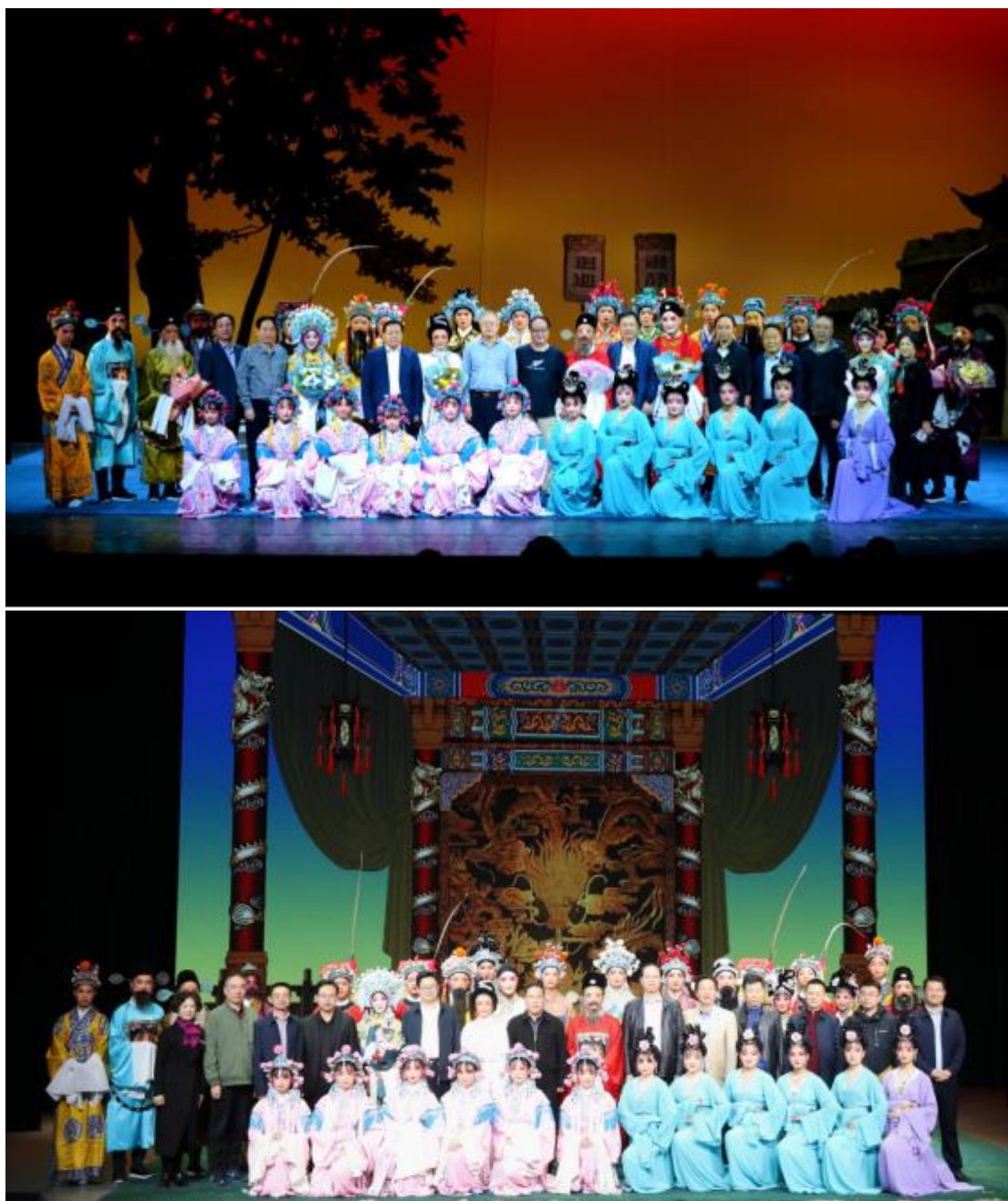
图5 系列 《喜脉案》演出剧照