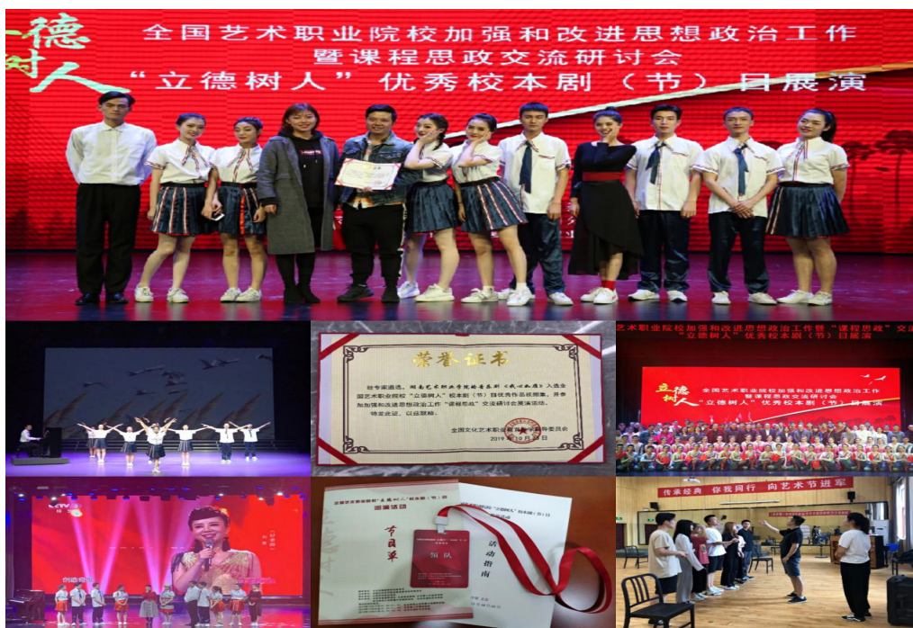
图 6 系列 《我心如雁》系列课程思政演出活动

近年来，湖南艺术职业学院着力推进教育教学改革，通过“剧目驱动”促进教学相长，坚持“课程思政”实现立德树人，全面推行学分制改革等活动，全面凸显了教学中心地位，为师生营造了浓厚学习氛围。