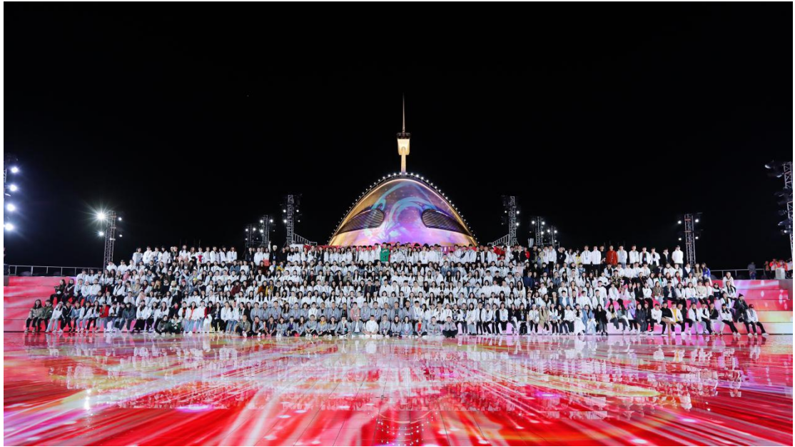
图 9 系列 湖艺学子两年亮相央视春晚舞台

4. 服务社区。 学院充分利用和挖掘自身丰富的艺术教育资源，开展一系列文化惠民、服务地方、下沉社区的活动。按照“走出去，请进来”的形式，让艺术教育贴近社区、贴近生活、贴近群众，进一步加强学校、家庭、社区的交流与合作，搭建一座广大市民群众广泛接触高雅艺术的桥梁，广泛开展演艺进社区、培训进社区、文化志愿队伍进社区等高雅艺术进社区系列展示活动和开放校园活动，将高雅艺术进社区活动打造成为城市文化建设的知名艺术品牌。比如 2019 年 7 月 1 日晚，由湖南艺术职业学院主办的首届松雅艺术节“颂歌献给共产党”——庆祝建党九十八周年交响音乐会，为学校周边社区群众和全院师生奉献了一道艺术盛宴。全年为学校周边社区开展少儿艺术培训 281 人次，开设舞蹈、儿童画、主持人、声乐、钢琴、古筝等六个专业，进一步丰富了社区居民精神文化生活，提高人文素养。