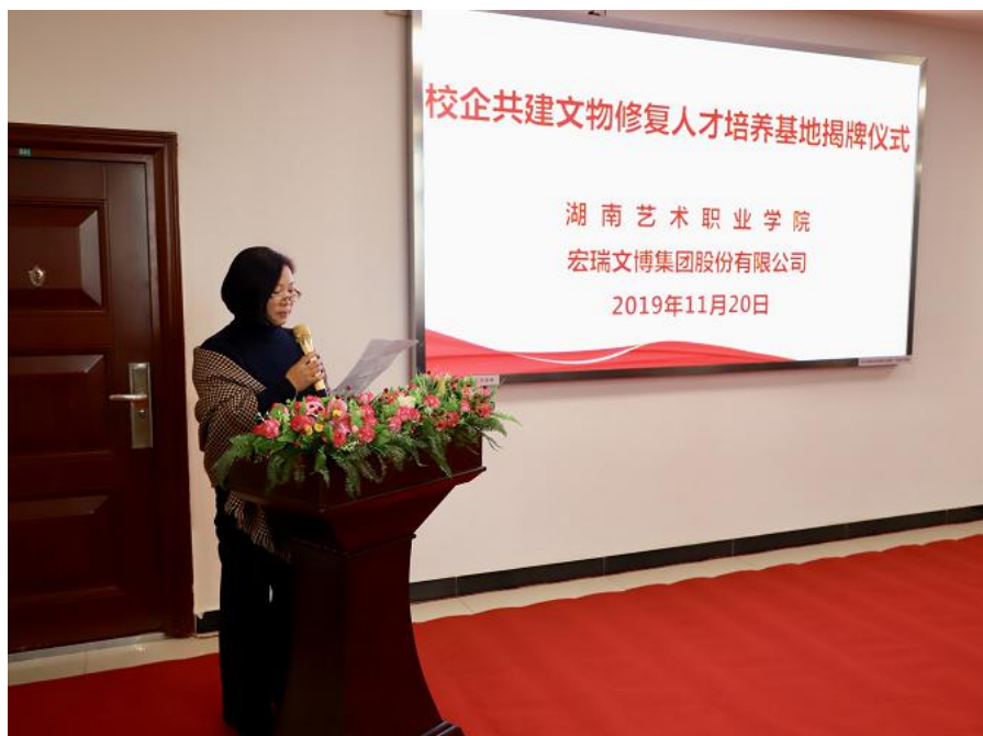
图4 “文物修复人才培养基地”揭牌仪式

我院戏剧系与岳阳巴陵戏传承研究院合作开办岳阳巴陵戏表演专业、与邵阳花鼓戏保护传承中心合作开办邵阳花鼓戏表演专业；美术系与新迈尔北京科技有限公司开办广告设计与制作 UI 专业、影视照明技术与艺术专业；影视系与“时光坐标”影视传媒公司合作开办影视后期合成专业、剪辑调色专业、栏目包装专业；学院与宏瑞文博集团股份有限公司就文化旅游系文物修复与保护特色专业深化校企合作，设立“文物修复人才培养基地”。学生通过院团企业的实操型练习，积累丰富的舞台工作经验，为就业和创业打下坚实的基础。